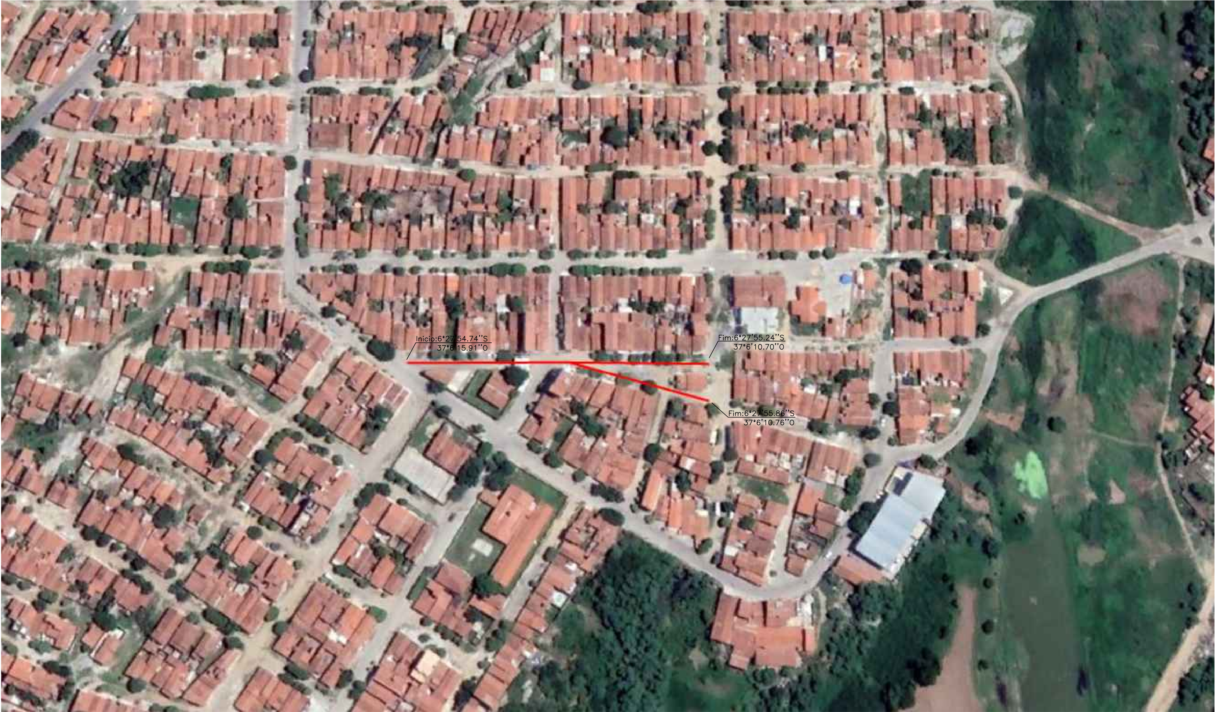
PLANTA DE SITUAÇÃO Pavimentações, Caicó/RN Sem escala