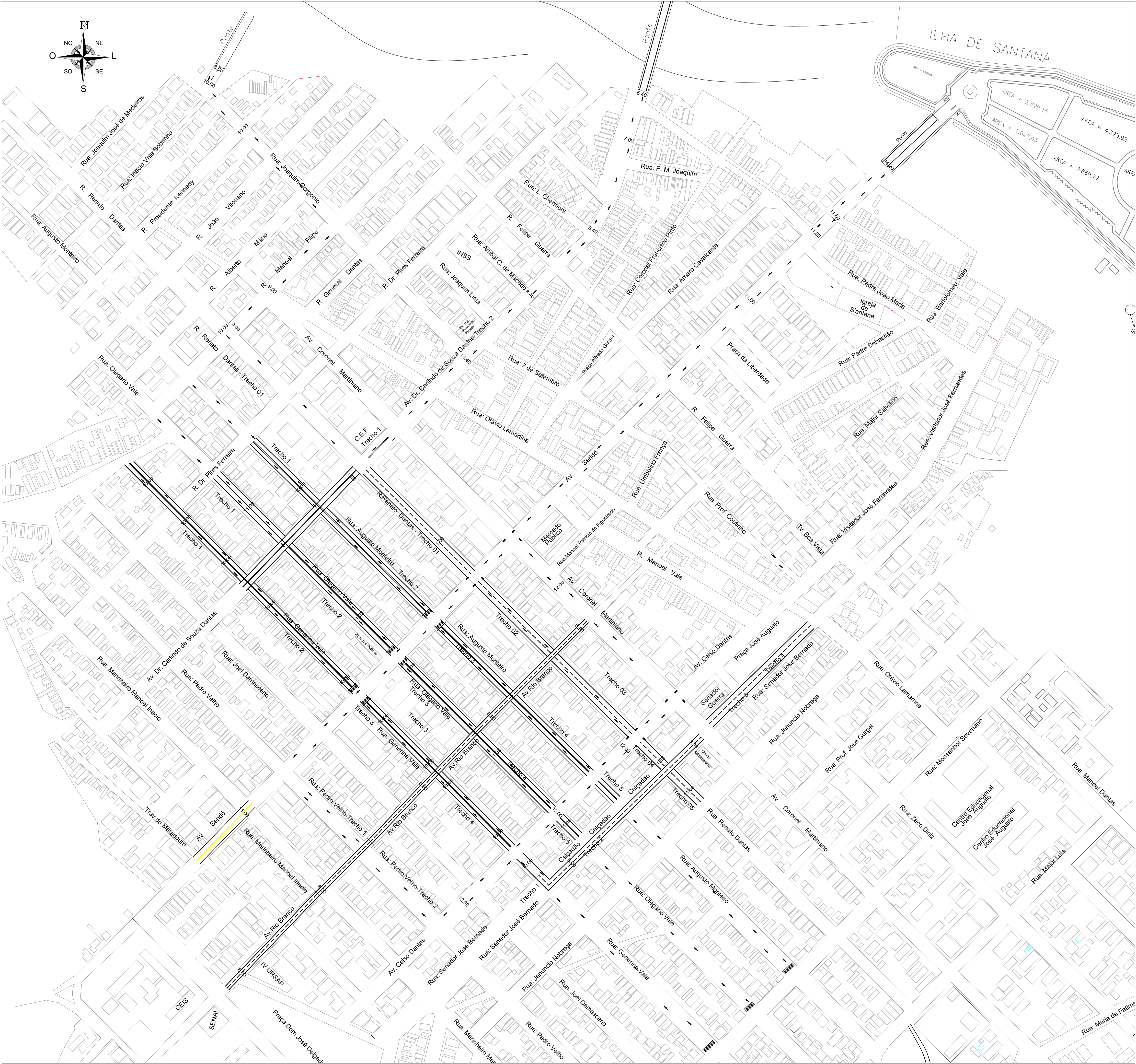
PLANTA BAIXA DE SINALIZAÇÃO HORIZONTAL Pavimentações, Calço/RN Escala: 1/2000