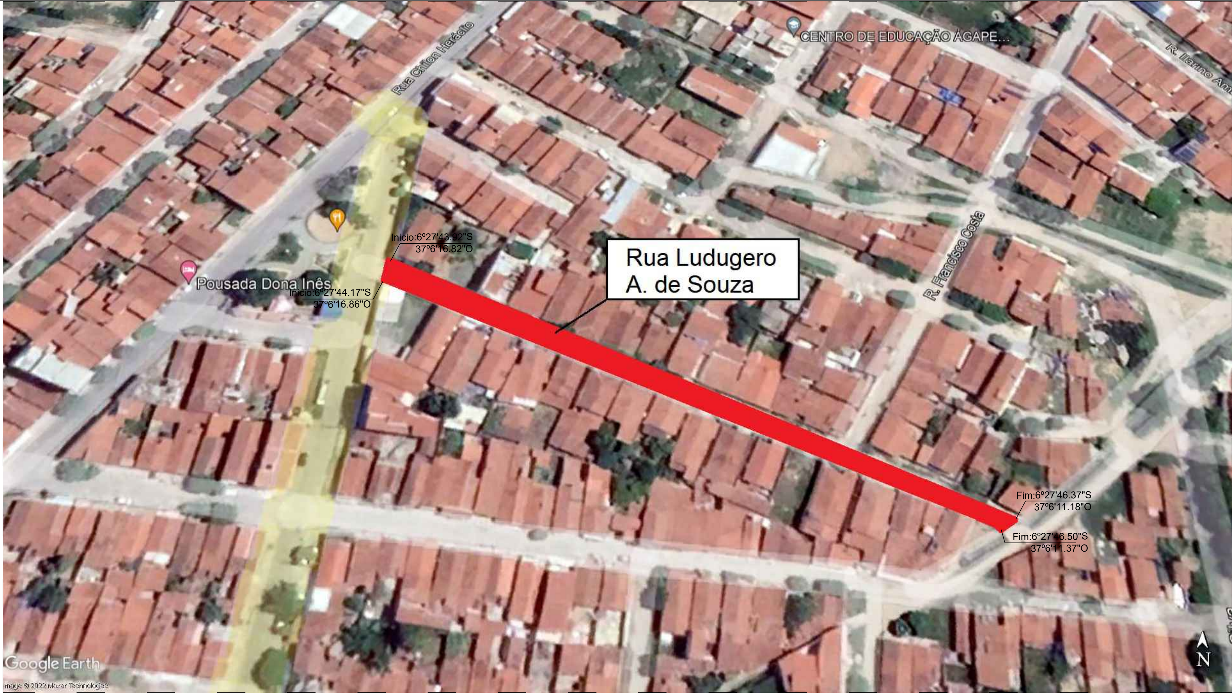
PLANTA DE SITUAÇÃO Pavimentações, Caicó/RN Sem escala