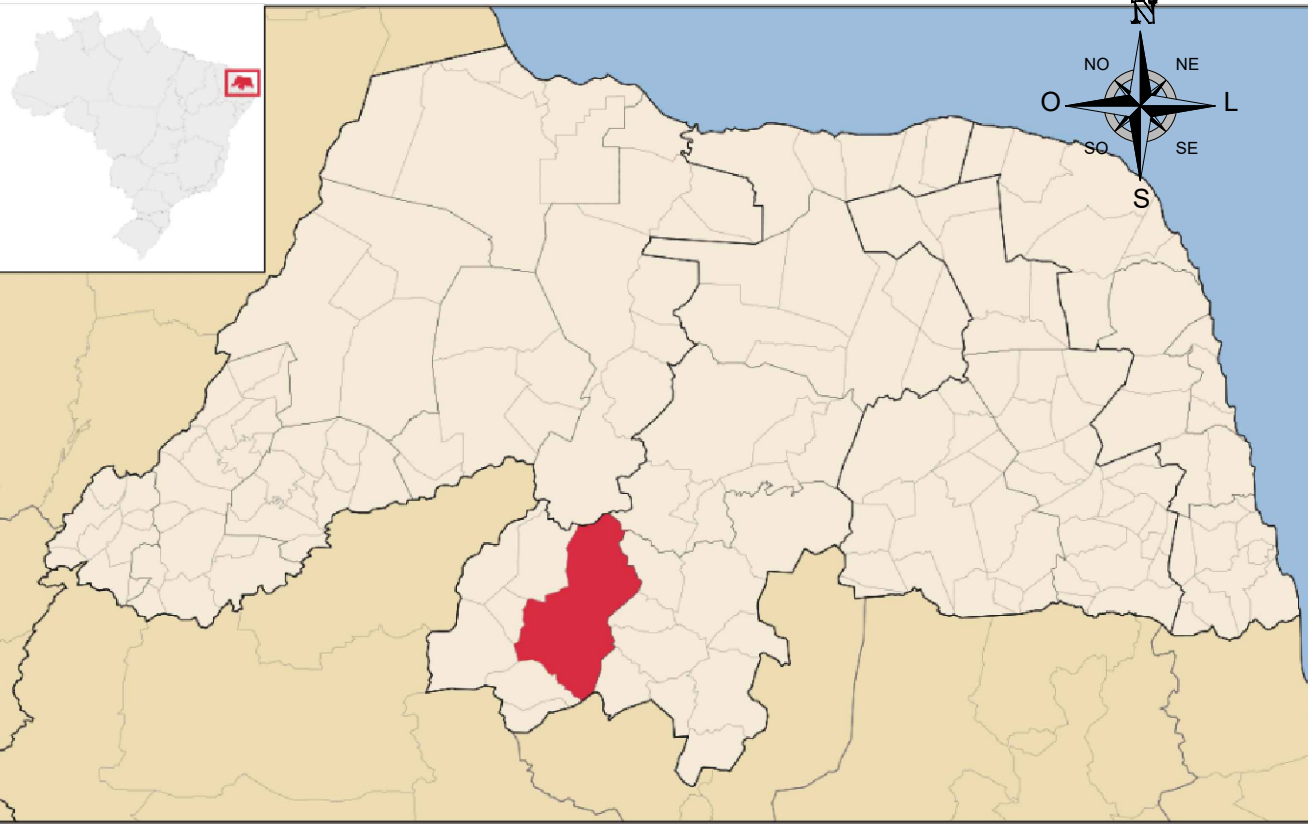
PLANTA DE LOCALIZAÇÃO Pavimentações, Caicó/RN Sem escala