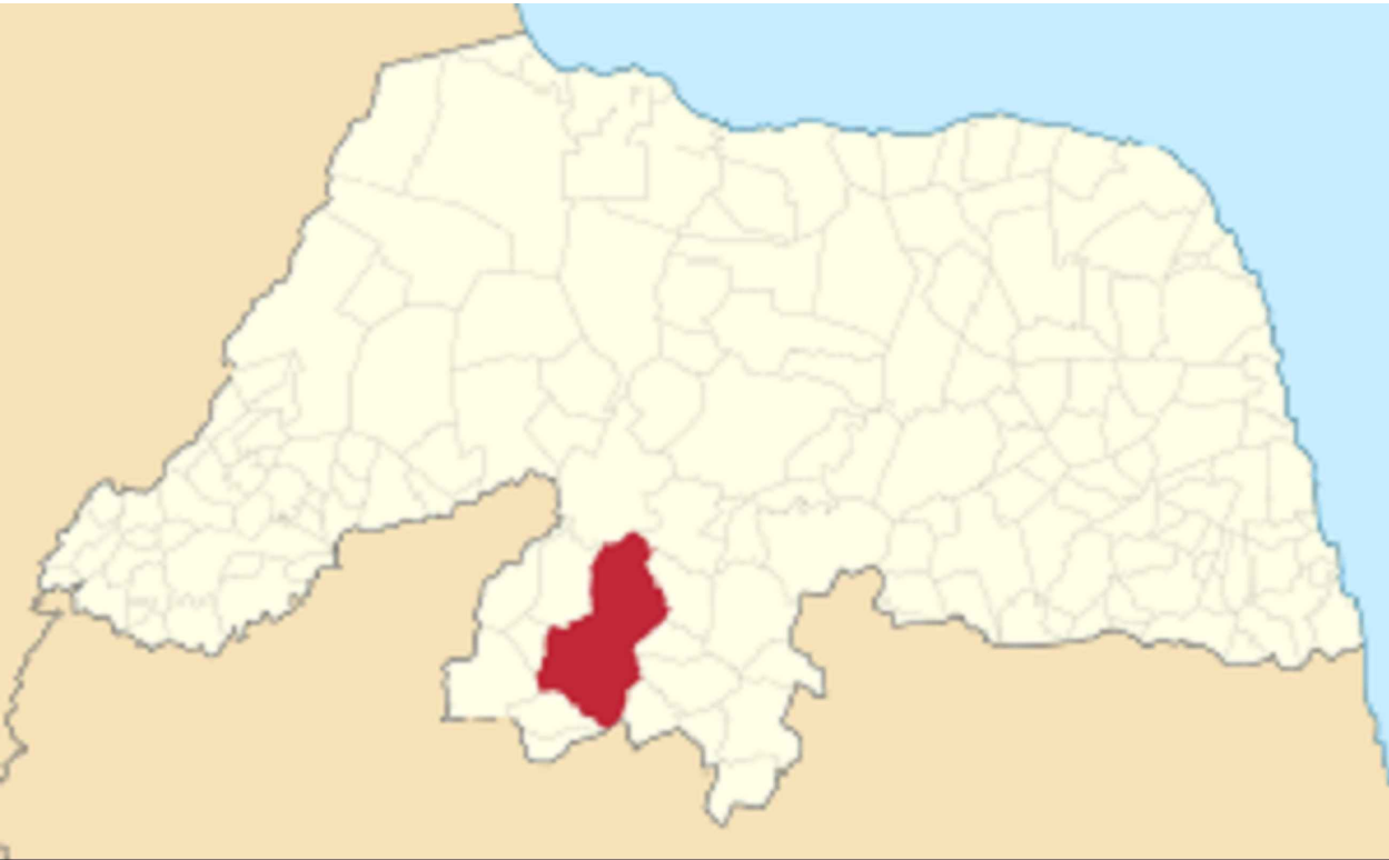
PLANTA DE LOCALIZAÇÃO Pavimentações, Caicó/RN Sem escala