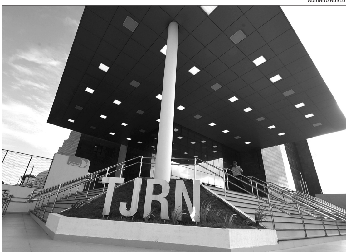
Segundo o TJRN, serão expedidos ofícios ao Banco do Brasil na próxima semana

nutos foram realizados 328 cálculos de atualização de valores já com a expedição, concomitante, da decisão de pagamento e determinação de expedição de ofício para a instituição financeira, para que esta faça a individualização das contas e a partir daí serem feitos os pagamentos”, reforça o juiz.