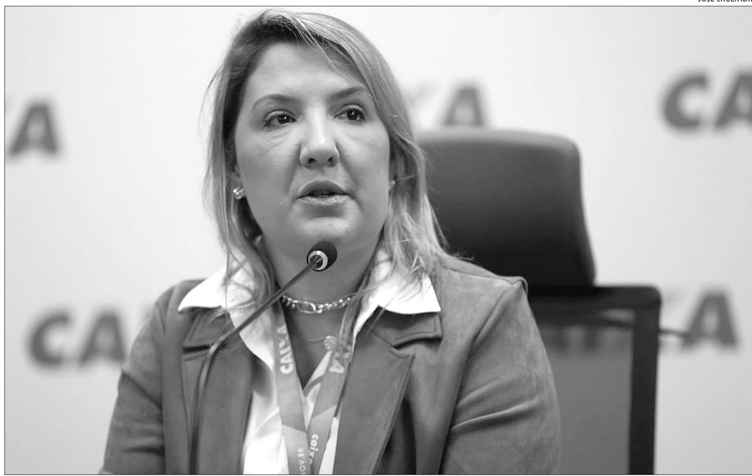
Além da antecipação do calendário do Auxílio Brasil, Governo vai lançar ações para o estímulo à independência feminina

De acordo com simulações do diretor-executivo da Associação Nacional de Executivos de Finanças, Administração e Contabilidade (Anefac), Miguel Ribeiro de Oliveira, com uma parcela mensal de R$ 160 significa que a pessoa conseguiria levantar um empréstimo de R$ 2.569,34 a ser pago em 24 parcelas mensais de R$ 160,00 com