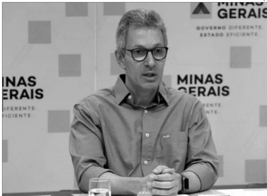
Para o PL, o governador de Minas Gerais, Romeu Zema, é um importante ativo eleitoral para 2026

« MUDANÇA » Governador de Minas Gerais, Romeu Zema sairá do Novo para se filiar ao PL de Bolsonaro. Informação foi confirmada após reunião do partido