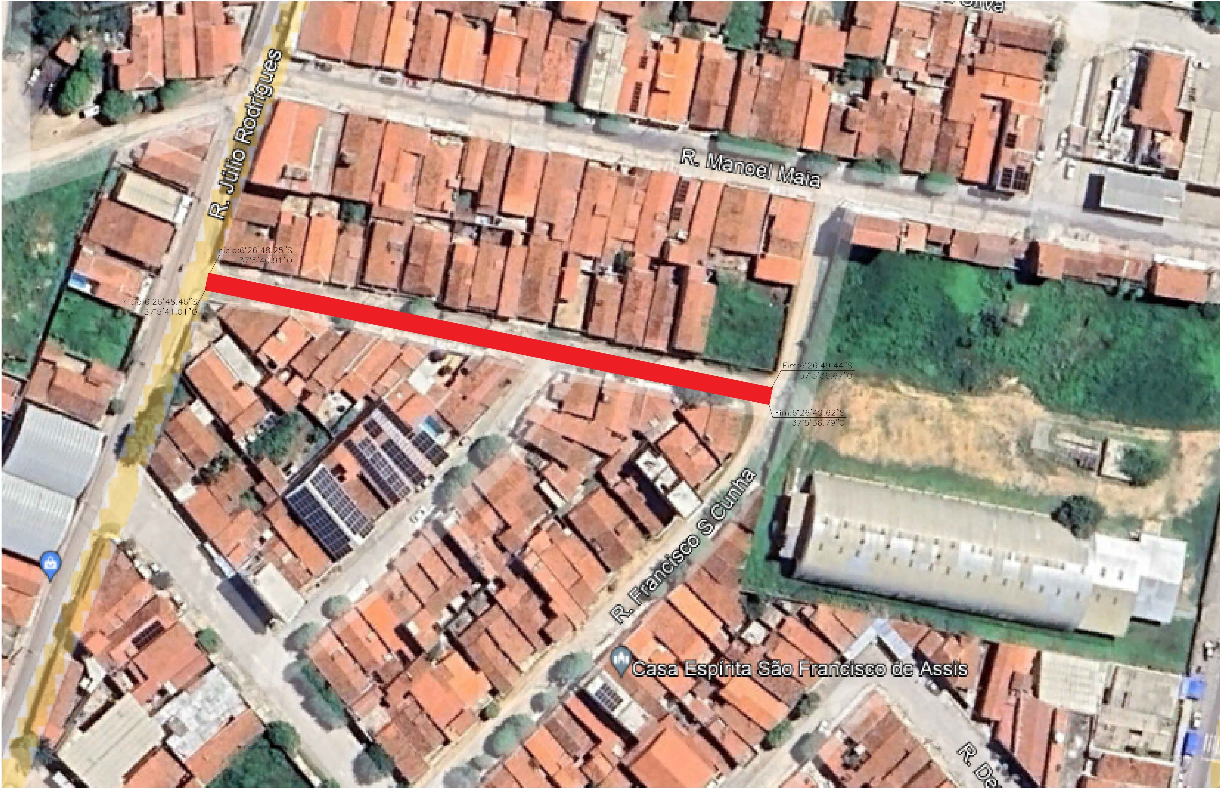
PLANTA DE SITUAÇÃO Pavimentações, Caicó/RN Sem escala