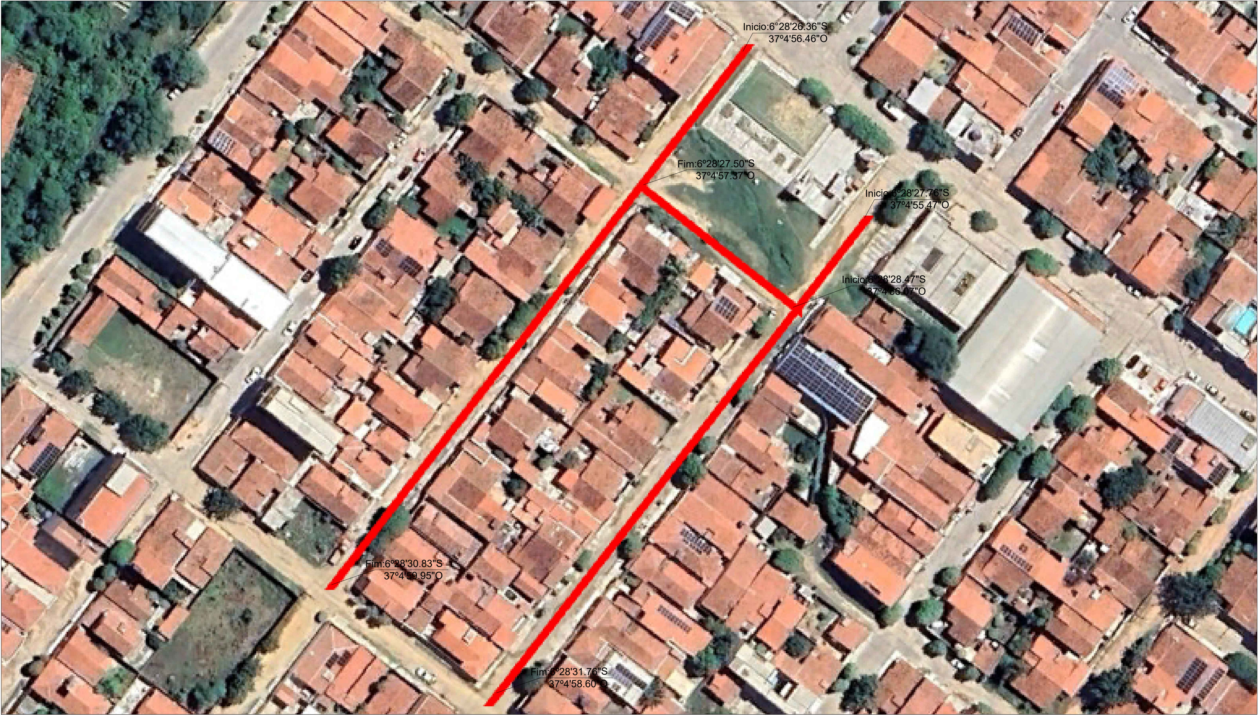
PLANTA DE SITUAÇÃO Pavimentações, Caicó/RN Sem escala