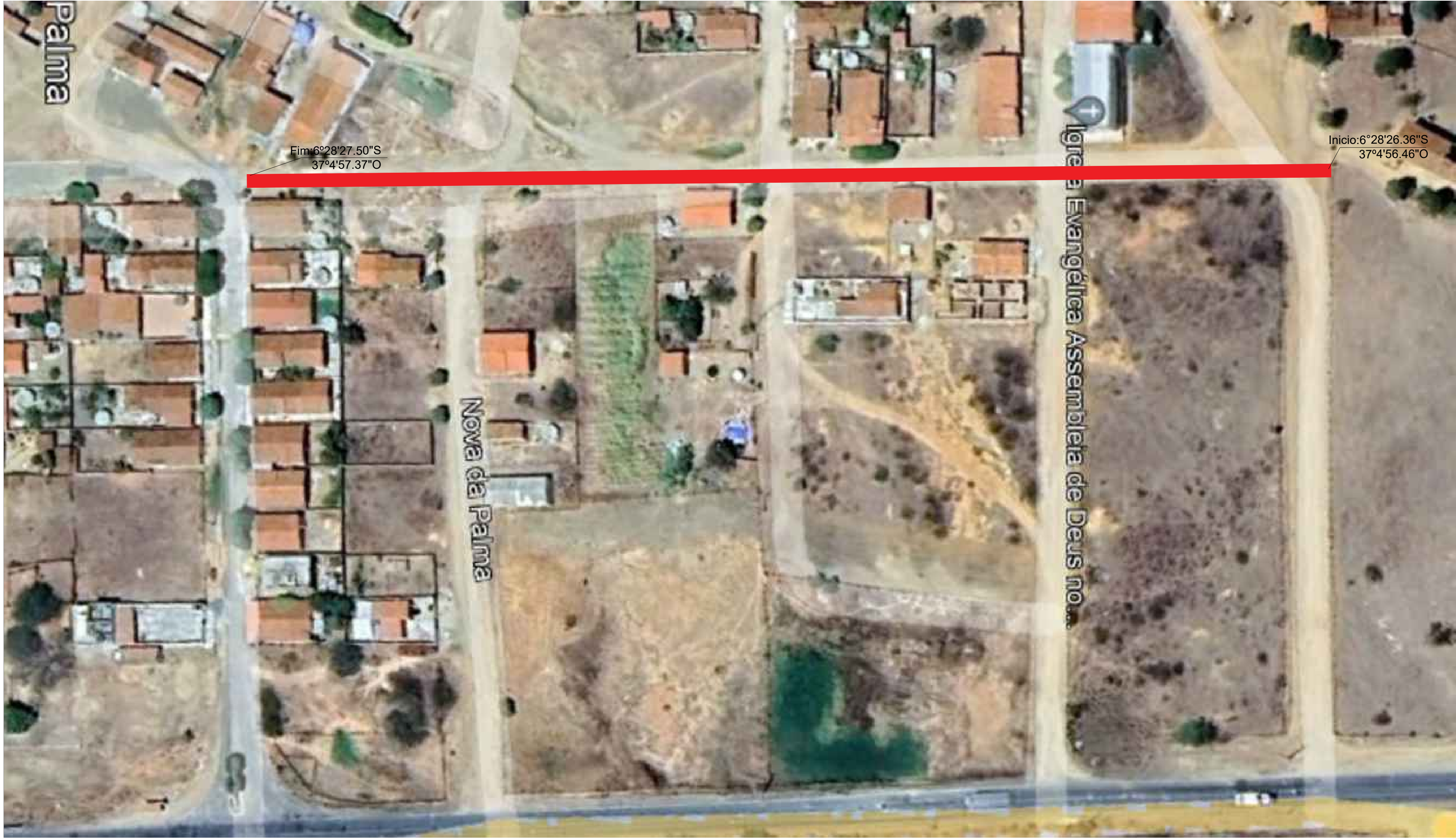
PLANTA DE SITUAÇÃO Pavimentações, Caicó/RN Sem escala