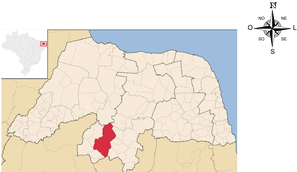
PLANTA DE LOCALIZAÇÃO Pavimentações, Caicó/RN Sem escala