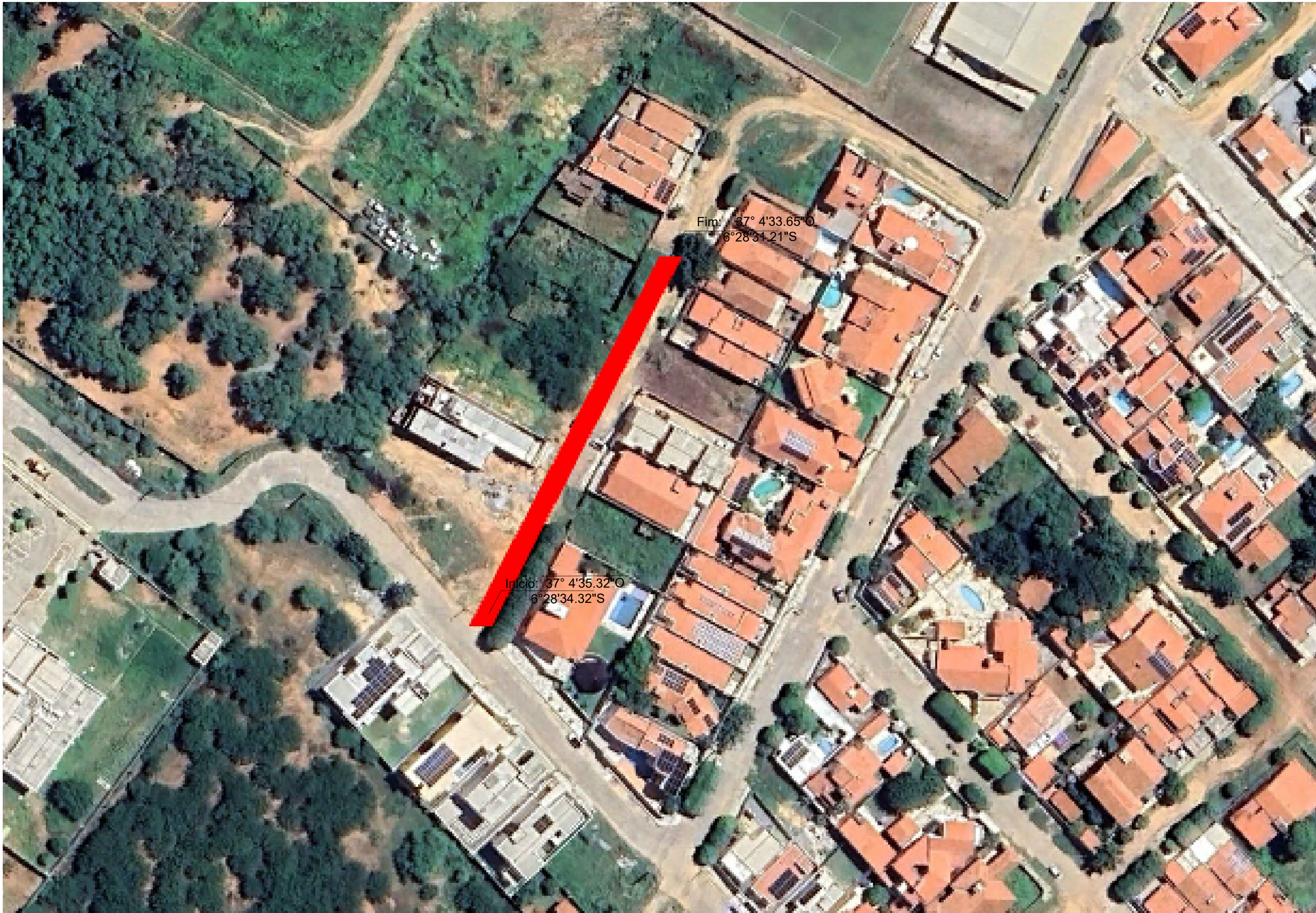
PLANTA DE SITUAÇÃO Pavimentações, Caicó/RN Sem escala