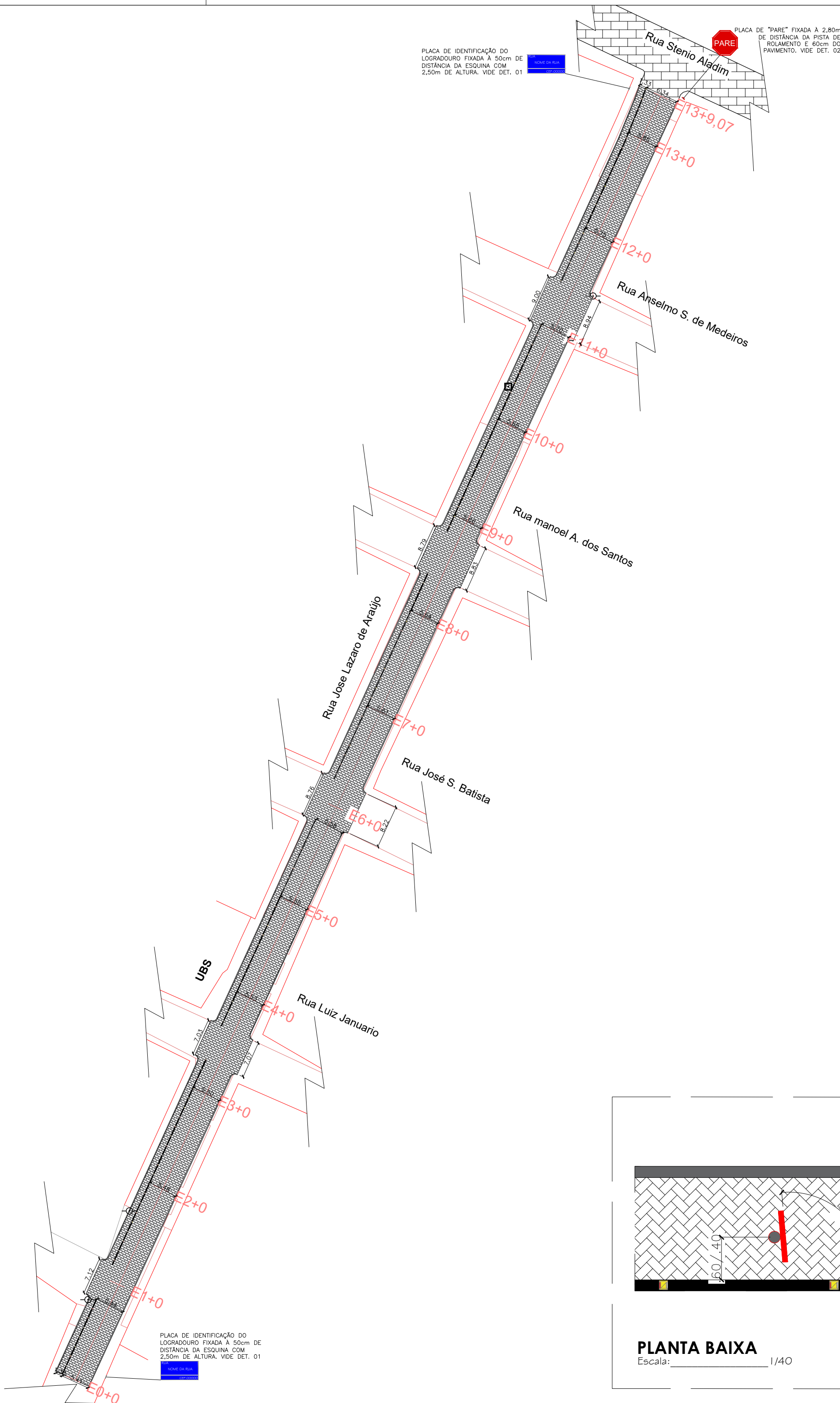
PLANTA BAIXA DA RUA JOSÉ LÁZARO DE ARAÚJO Pavimentações, Caicó/RN Escala: 1/600