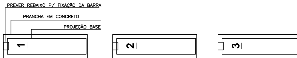
EQ. 02 PRANCHAS DE EXERCÍCIO ABDOMINAIS ESC - 1/50