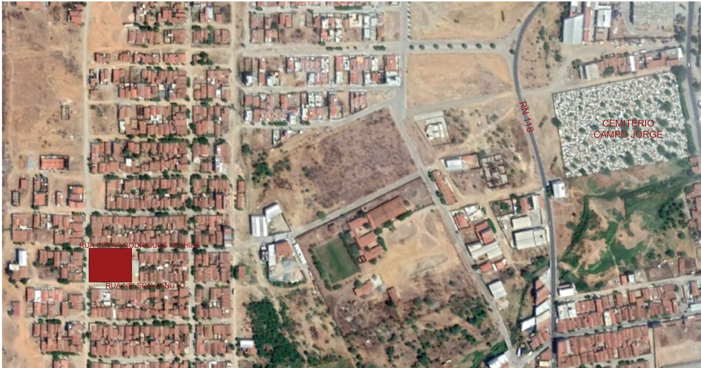
PLANTA DE SITUAÇÃO PRAÇA DO RECREIO SEM ESCALA