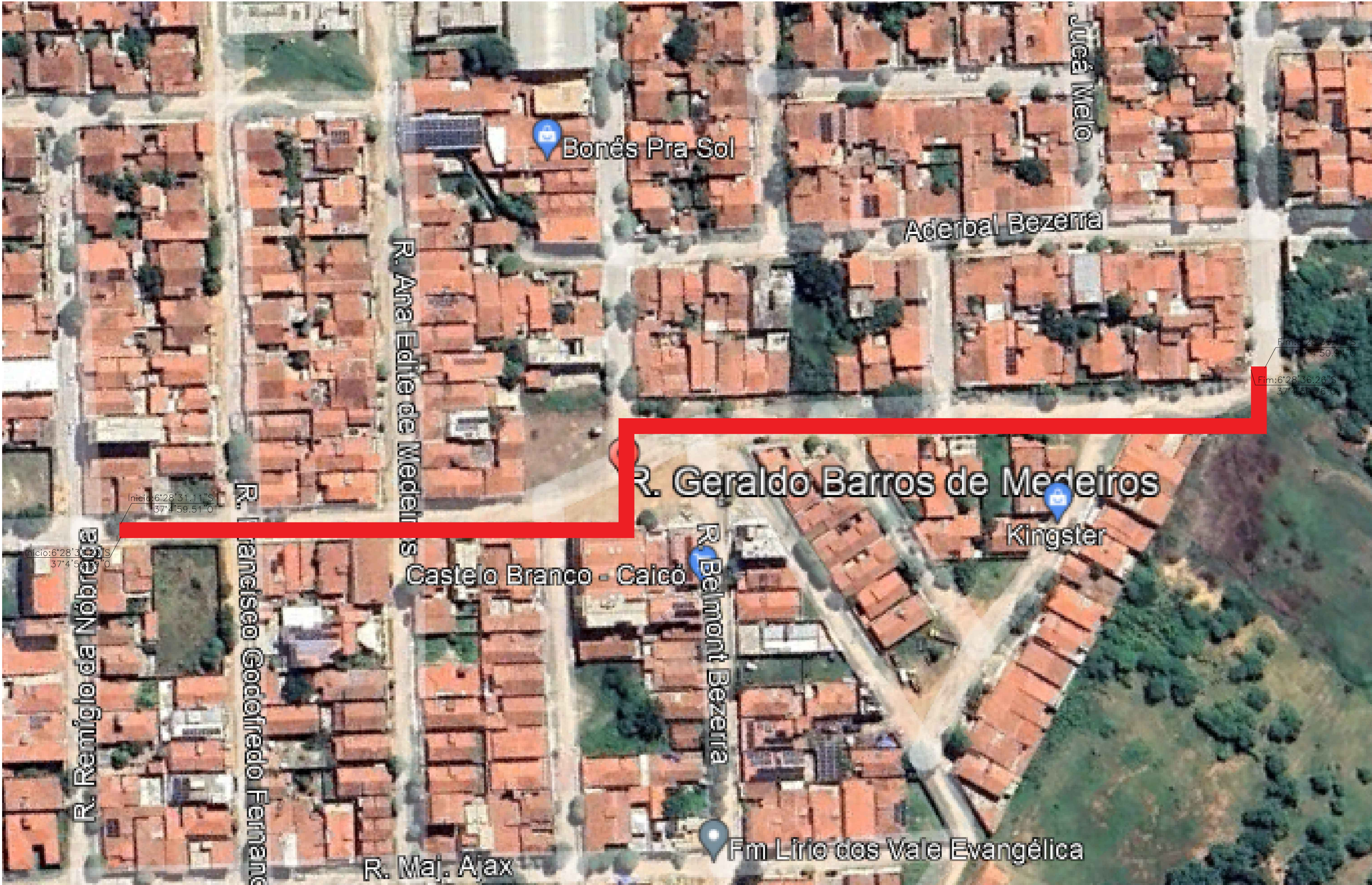
PLANTA DE SITUAÇÃO Pavimentações, Caicó/RN Sem escala